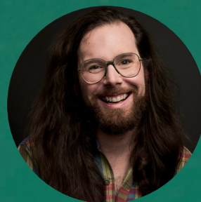
Adam Provencher SCÉNOGRAPHIE DÉCORS ET COSTUMES