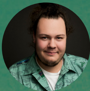
Félix Plante ACCESSOIRES, MARIONNETTE ET ASSISTANCE AUX DÉCORS